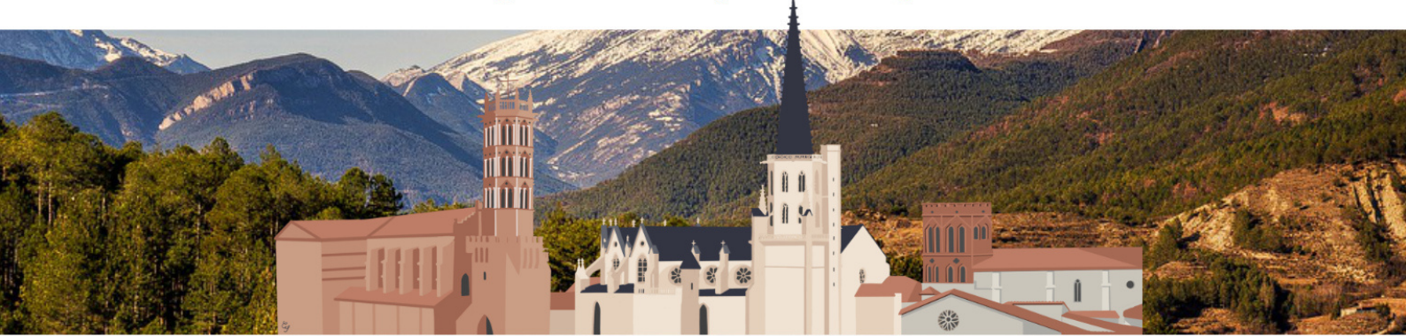
Cathédrale Saint Antonin - Pamiers

DIOCESE DE PAMIERS COUSERANS ET MIREPOIX