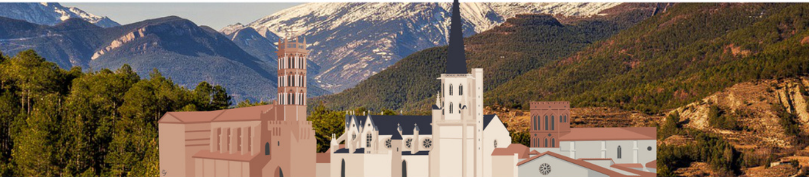
Cathédrale Saint Antonin - Pamiers

DIOCÈSE DE PAMIERS COUSERANS ET MIREPOIX